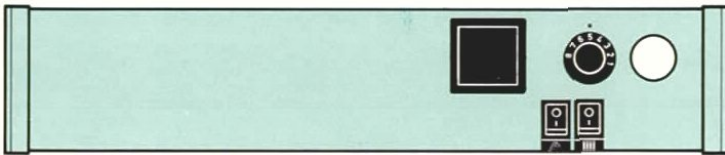
Zubehör Schalleiste mit Speichertemperaturregler