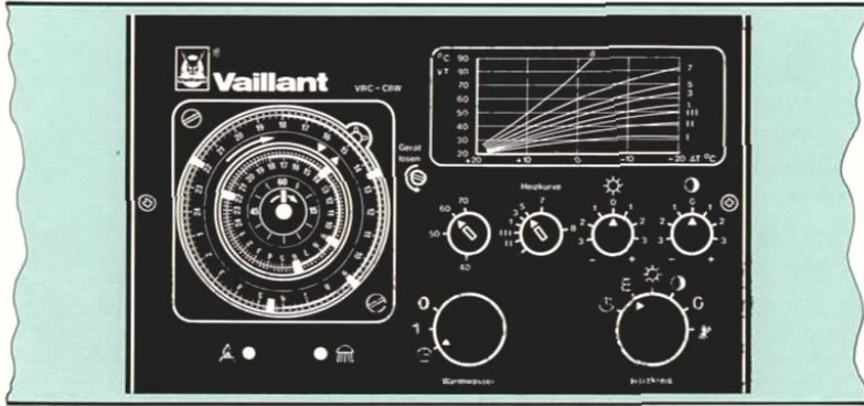
Zubehör VRC-Set BW für Öl/Gas-Spezialheizkessel