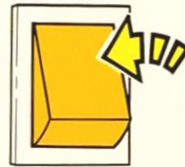
Taster zum Einschalten der Starkheizung (mit Kontrollleuchte)