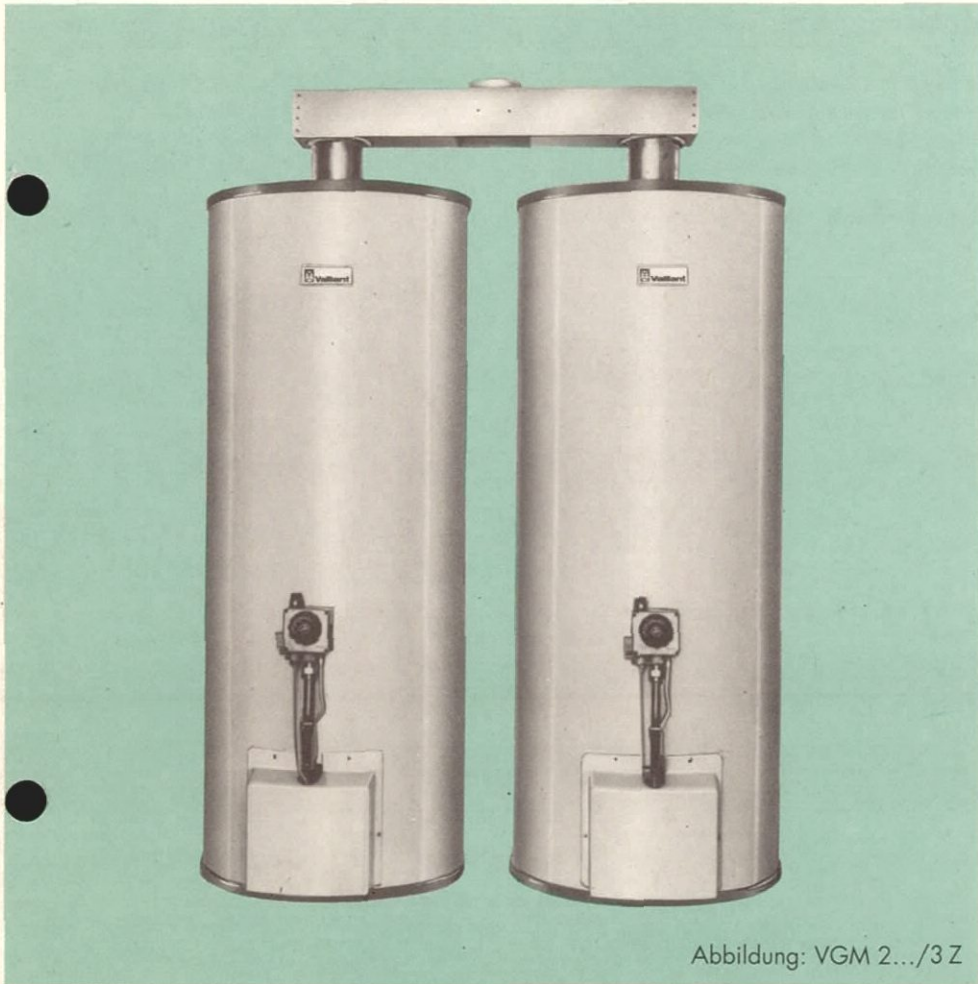
Abbildung: VGM 2.../3Z