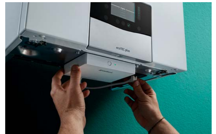
ecoTEC plus mit Internetmodul myVAILLANT connect

Dieses Gas-Brennwertgerät punktet nicht nur mit seinem Top-Preis-Leistungs-Verhältnis, es bietet auch viele Optionen: Der ecoTEC plus ist mit Leistungsgrößen von 10 bis 30 kW optimal für Einfamilien- und Mehrfamilienhäuser geeignet. Er ist als reines Heizgerät (VC), als Kombigerät mit integrierter Warmwasserbereitung (VCW) oder mit integriertem Speicher (VCI) erhältlich. Die Kombigeräte gibt es mit 20 und 25 kW Leistung.