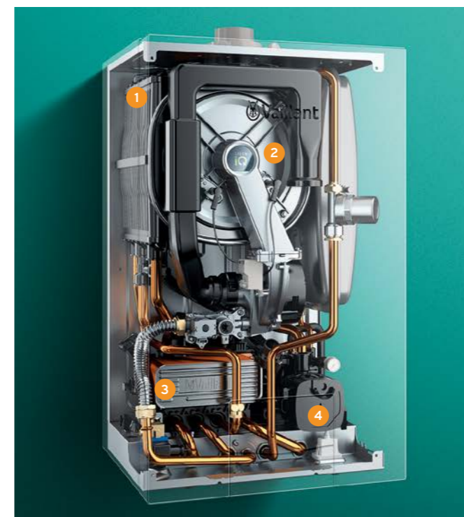
ecoTEC exclusive VCW mit integrierter Warmwasserbereitung