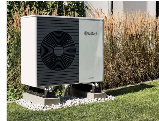
Hybridsystem aus Gas-Brennwertgerät, Puffer- und Warmwasserspeicher sowie Luft/Wasser-Wärmepumpe